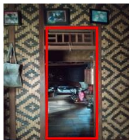
Gambar 5. Pintu Depan Rumah Adat Suku Baduy