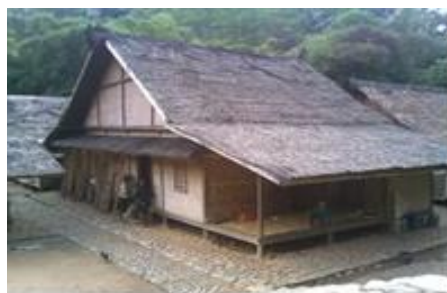
Gambar 1. Rumah Adat Suku Baduy

Rumah adat suku Baduy dibagi dalam 3 ruangan yaitu bagian sosoro (depan), tepas (tengah) dan ipah (belakang). Masing-masing ruangan berfungsi sesuai dengan rencana pembuatan. Pada bagian depan rumah atau yang biasa disebut sosoro berfungsi sebagai ruang penerima tamu. Hal ini dikarenakan tamu tidak diperkenankan masuk ke dalam rumah. Fungsi lainnya digunakan sebagai tempat bersantai dan menenun bagi kaum perempuan. Bagian depan ini berbentuk melebar ke samping dengan lubang di bagian lantainya. Sedangkan bagian tengah atau biasa disebut tepas digunakan untuk aktivitas tidur dan pertemuan keluarga. Sementara pada bagian belakang rumah atau biasa disebut imah digunakan sebagai tempat untuk memasak serta menyimpan hasil ladang dan beras. Tiap ruangan ini dilengkapi dengan lubang pada bagian lantainya. Lubang di lantai rumah Suku Baduy berfungsi sebagai sirkulasi udara. Ini dikarenakan rumah adat Suku Baduy tidak dilengkapi dengan jendela. Tujuan tidak dibangunnya jendela agar para penghuni rumah yang ingin melihat keluar diharuskan pergi untuk melihat sisi bagian luar rumah. Seperti gambar 1. berikut.