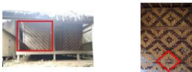
Gambar 4. (a) Sisi Depan Dinding; (b) Anyaman Dinding

Dinding bangunan ini menggunakan anyaman bambu yang mampu bertahan hingga usia 5 tahun. Dinding anyaman bambu ini merupakan dinding yang memiliki “pori-pori” yang berfungsi sebagai ventilasi udara sehingga ruangan tetap sejuk dan kering. Berdasarkan gambar 4. tersebut, dinding rumah adat suku Baduy membentuk bangun datar segi empat dan anyaman pada dinding membentuk bangun datar belah ketupat.