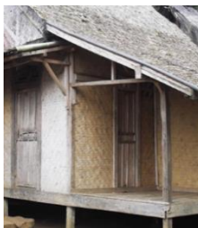
Gambar 6. Tiang Penyangga Rumah Adat Suku Baduy

d. Tiang Penyangga Rumah Adat Suku Baduy.