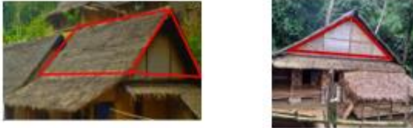
Gambar 3. (a) Sisi Kiri Atap; (b) Sisi Depan Atap

Rangka atap bangunan ini menggunakan kayu dengan rangka penutup atap dari bambu, sementara penutup atapnya menggunakan palupuh atau daun kelapa kering sebagai pelindung panas dan hujan. Berdasarkan gambar 3. tersebut, atap rumah adat suku Baduy berbentuk segitiga dan prisma segitiga apa bila dimodelkan secara geometri.