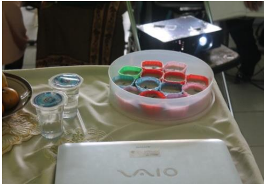
Gambar 6. Produk pudding salak

Pembuatan puding salak yang paling banyak diminati pada saat pelatihan, karena rasa bahan dasar dari salk sangat terasa sekali, selain memberikan aroma yang sedap, juga segar rasanya.