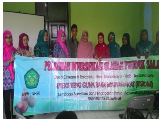
Gambar 3. Masyarakat peserta pelatihan

produk salak, sehingga salak Cineam memiliki nilai yang lebih ekonomis dan diterima oleh pasar baik di Tasikmalaya maupun di luar Tasikmalaya.