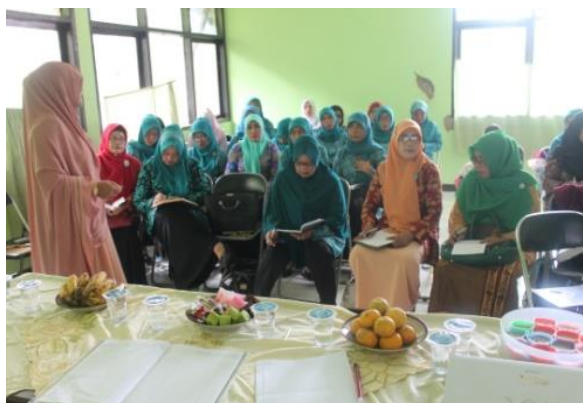
Gambar 2. Pelaksanaan pelatihan

Dari permasalahan yang dihadapi oleh mitra, solusi yang tepat adalah dilakukan pelatihan diversifikasi produk salak Cineam untuk menambah pengetahuan dan keterampilan masyarakat Desa Cineam dan Rajadatu terletak di kecamatan Cineam kabupaten Tasikmalaya. Observasi yang telah dilakukan di lapangan terdapat hasil panen salak yang berlimpah tetapi selalu mengalami harga yang dibawah pasar, karena salak kalah bersaing terhadap salak jenis pondoh yang berasa lebih manis.