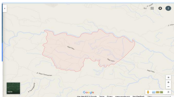
Gambar 1. Peta Desa Rajadatu Kecamatan Cineam Kabupaten Tasikmalaya