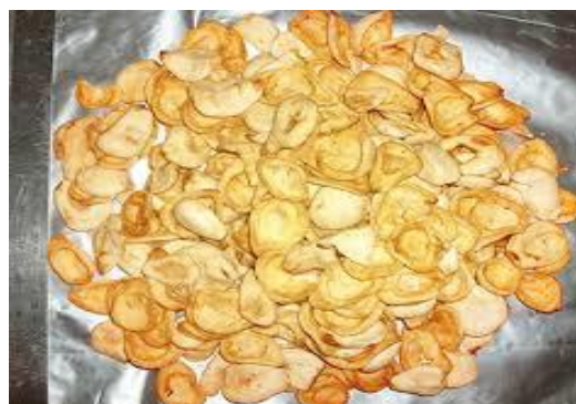
Gambar 4. Produk keripik salak

Beberapa produk salak yang dapat dideversifikasi menjadi makanan yang enak, dan bisa disimpan dalam waktu relative lama tanpa adanya bahan pengawet, diantaranya adalah : Dodol salak, manisan dan asinan salak, sirup salak, keripik salak dll.