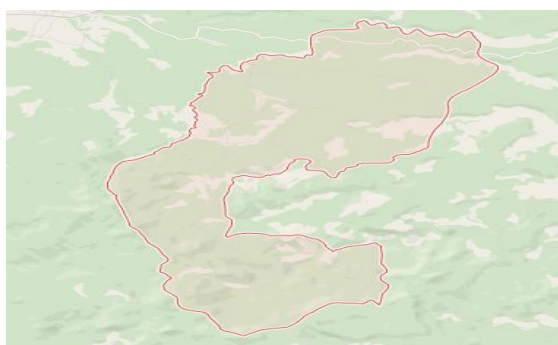
Gambar 2. Peta Desa Cineam Kecamatan Cineam Kabupaten Tasikmalaya.

Desa Cineam dan Desa Rajadatu Kecamatan Cineam, Kabupaten Tasikmalaya adalah sebuah desa penghasil salak ( Salacca Zalacca ) yang sering dikenal dengan nama salak Cineam. Perubahan perekonomian dan peningkatan jumlah penduduk setempat memiliki dampak dalam di bidang sosial, ekonomi, dan pertanian, sehingga menyebabkan peningkatan kebutuhan keluarga. Banyaknya pendatang salak jenis lain yang lebih manis membuat petani salak semakin merugi.