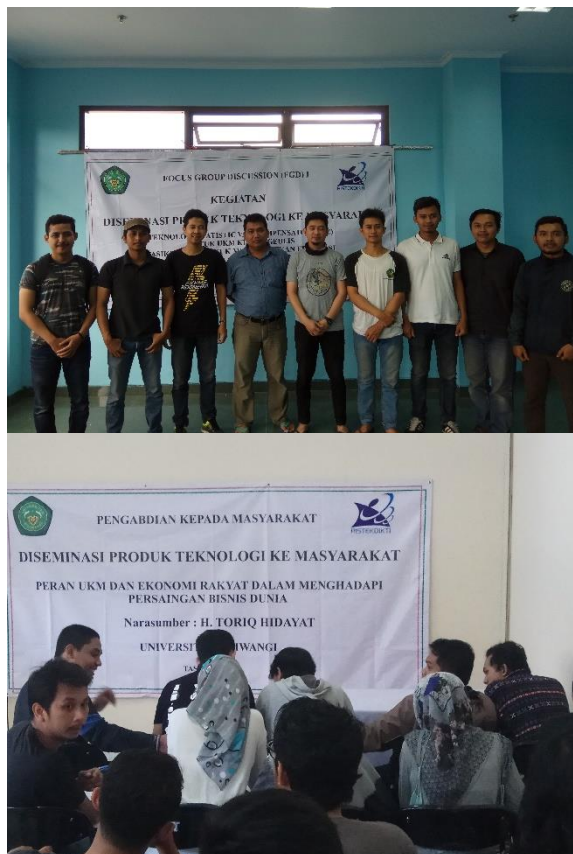
Gambar 6. Pelaksanaan pelatihan di rumah produksi mitra

Materi awal adalah mengenai audit energi. Audit energi merupakan kegiatan untuk mengidentifikasi dimana dan berapa energi yang digunakan serta berapa potensi penghematan yang mungkin diperoleh dalam upaya mengoptimalkan penggunaan energi pada fasilitas unit/sistem gedung.