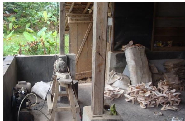
Gambar 4. Proses penghalusan krom geulis menggunakan teknik manual dan mesin amplas

memiliki pelanggan tersebar mulai dari Aceh hingga Papua. Produksi per bulan adalah 400-1400 pasang. Produk juga dijual kepada toko dan konsumen langsung. Salwa memiliki pelanggan tetap yang menerima produk Salwa per bulan diantaranya Palembang 300 pasang, Sulawesi 120 Pasang, Bandung 100 pasang, ditambah pelanggan tidak tetap hingga mencapai 1400 pasang. Omzet Salwa sekitar 20 juta per bulan (Nuraeni. Andini. 2015).