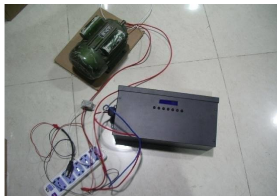
Gambar 7. Gambar media interaktif contoh alat untuk penghematan energi listrik

Peluang efisiensi energi menggunakan Variable speed drive (VSD) pada Pompa Mengendalikan kecepatan mesin adalah cara yang paling efisien untuk mengontrol aliran, karena ketika kecepatan mesin berkurang, konsumsi daya listriknya juga berkurang. Untuk mengatur kecepatan mesin, metode yang umum yang paling efektif adalah digunakannya Variabel Speed Drive (VSD). VSD mampu untuk mengatur kecepatan pompa secara bervariasi