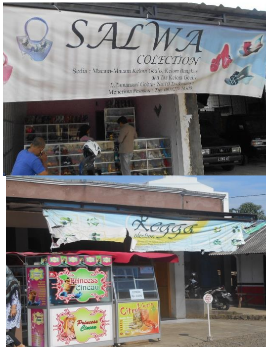
Gambar 1. UMKM Kelom Geulis SALWA dan REGGA