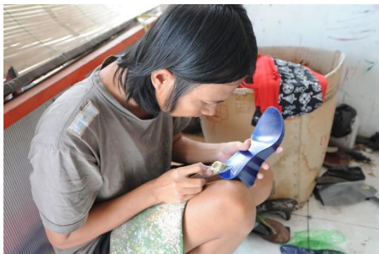
Gambar 2. Kondisi produksi kelom geulis di rumah produksi SALWA dan REGGA