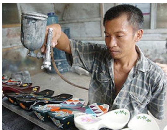
Gambar 3. Penggunaan mesin listrik pada rumah produksi SALWA dan REGGA

SALWA dan REGGA merupakan pengrajin kelom geulis yang sudah beroperasi selama 25 tahun,