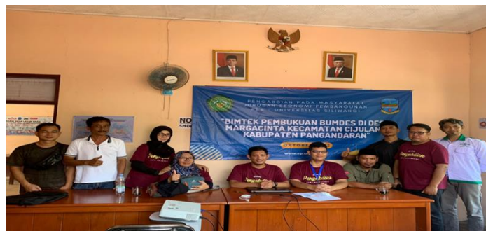
Gambar 4.1. Dokumentasi pelaksanaan FGD

Kegiatan FGD yang telah dilakukan mengangkat tema “Bimtek Pembukuan BUMDES di Desa Margacinta Kecamatan Cijulang Kabupaten Pangandaran”. Kegiatan ini diselenggarakan pada hari Sabtu, 23 Oktober 2022 pukul 10.15 - 11.00 WIB bertempat di Kantor Desa Margacinta Kecamatan Cijulang Kabupaten Pangandaran dan dilanjutkan pada hari minggu tanggal 24 Oktober 2022 pada pukul 10.00 – 11.00 . Topik bahasan dalam diskusi yang telah dilakukan yaitu: 1) Pembukuan Bumdes; 2) Kondisi barang/jasa yang diusahakan; dan 3) Sistem pelayanan pada konsumen.