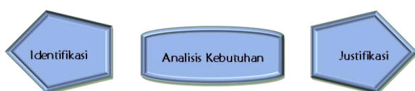
Gambar 3.1 Prosedur Kerja